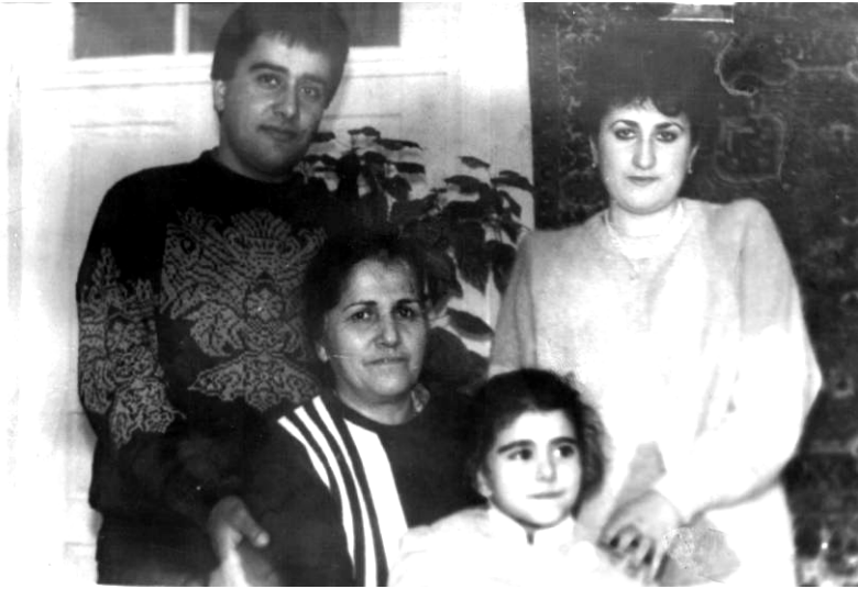
Ailə üzvləri ilə